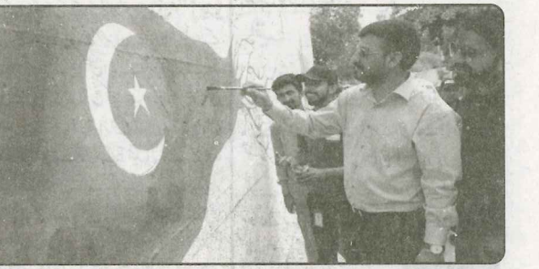
چیمبر میں ملدی شریعی عید اور یوم آزادی کے حوالے سے یونیورسٹی روڈ پر وال پینٹنگ کے افتتاح کے موقع پر وال پینٹنگ کر رہے ہیں

کی شدید کمی کو پورا کیا جاسکتا ہے، عوام کو درجیش سفری