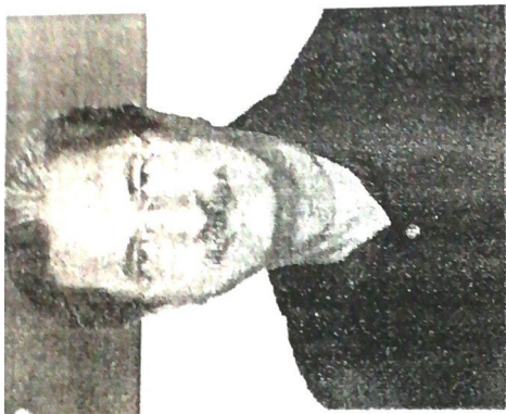
Shafqat Mahmood elected president of UNESCO's Education Commission