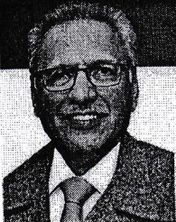
President Axi praises projects of Aab-e-Pak Authority