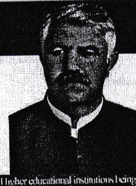
Higher educational institutions being setup in all KP districts Mahmood