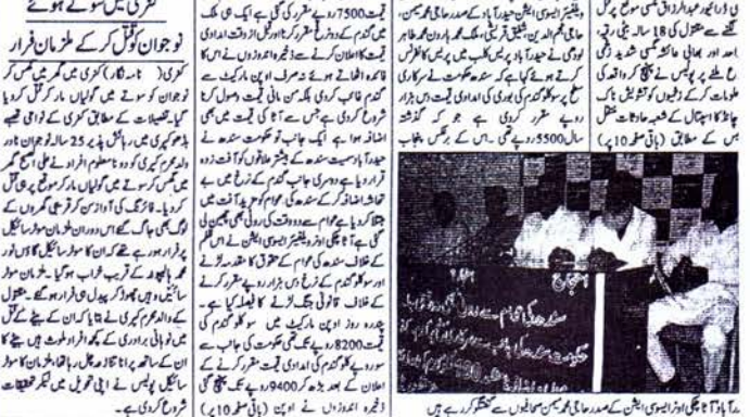
سندھ میں کیم کھانے کی بجائے کھانے کی کیم کی خبر دی ہے۔