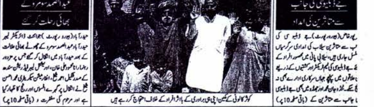
جناب میں سب کچھ سے بے خبر ہیں۔ وہاں ایک سنگھ میں ہم آج آئے۔ (پروفیسر احمد رضا)۔

ٹی وی کی بندش سے جس مالکان کا تاجر کا فائدہ اٹھانے لگے۔