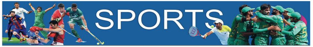
Friday November 08, 2024