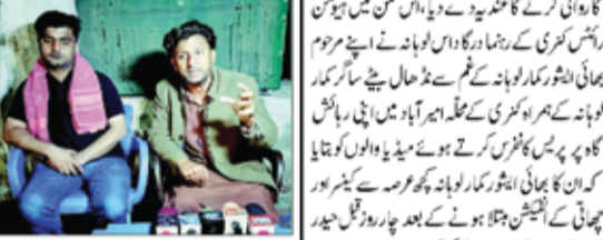
کسری: جمعی خبیروں کے خلاف قانونی کارروائی کا اعلان کیا گیا۔ پریس کانفرنس میں اعلان کیا گیا۔

جمعی خبیروں کے خلاف قانونی کارروائی کا اعلان کیا گیا۔ پریس کانفرنس میں اعلان کیا گیا۔